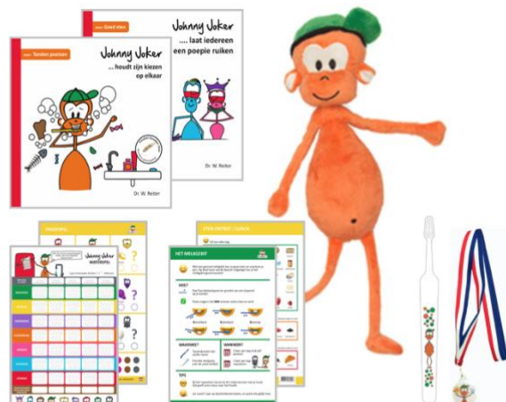
Tools en beloningen